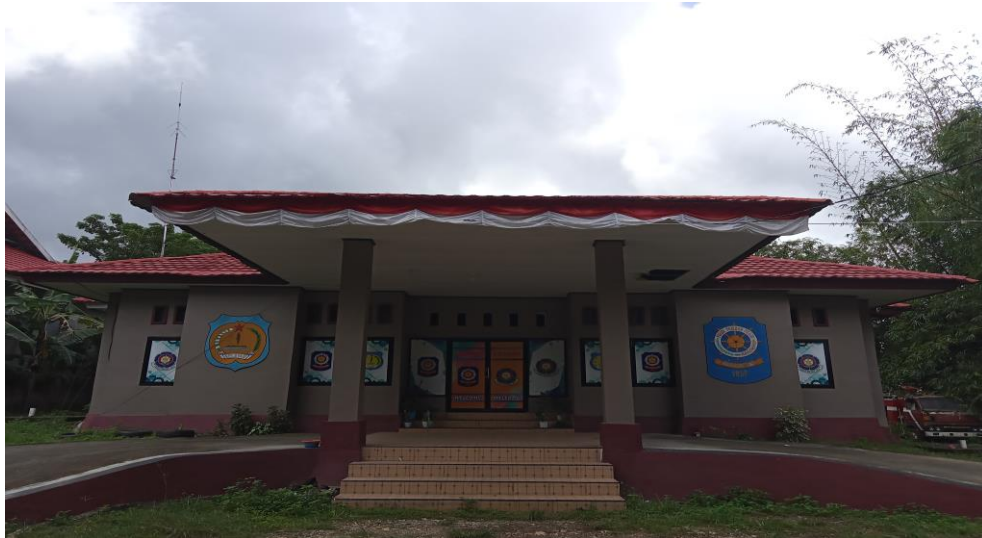
Gambar 1 Satpol PP, Damkar dan Penyelamatan

Secara Geografis Satuan Polisi Pamong Praja, Pemadam Kebakaran dan Penyelamatan Kabupaten Kepulauan Selayar terletak antara 6,12°S dan 120,47°E yang beralamat di jalan Jendral Ahmad Yani Nomor 4 Selayar merupakan Tipe A. Alamat Email kantor Satpolppdamkarselayar68@gmail.com dan Nomor Telpon Kantor (0414) 21004. Satuan Polisi Pamong Praja, Pemadam Kebakaran dan Penyelamatan Kabupaten Kepulauan Selayar merupakan salah satu perangkat daerah di lingkungan Pemerintahan Kabupaten Kepulauan Selayar sebagai instansi mempunyai tugas membantu Bupati melaksanakan urusan pemerintahan bidang Satuan Polisi Pamong Praja, Pemadam Kebakaran dan Penyelamatan yang diberikan kepada Kabupaten. Perangkat Daerah ini berdiri berdasarkan Peraturan Bupati Nomor 125 Tahun 2021 tentang Kedudukan, Susunan Organisasi, Tugas dan Fungsi, serta Tata Kerja Satuan Polisi Pmong Praja, Pemadam Kebakaran dan Penyelamatan Kabupaten Kepulauan Selayar